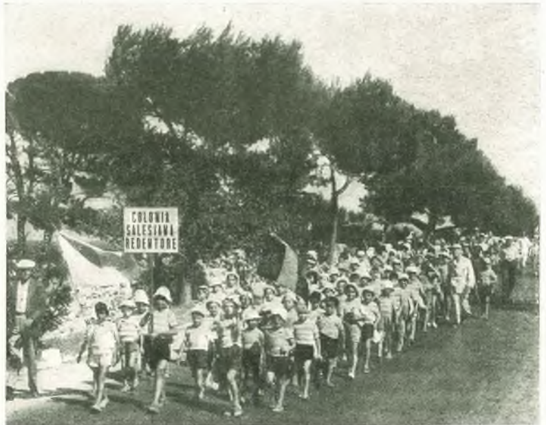
Bari - La nostra Colonia.

L'opera importò sacrifici non lievi, sia per l'assistenza assunta da suore insegnanti, senza al-