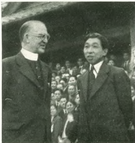
GIAPPONE - L'apostolo dei fanciulli il compianto Mons. Flanagan e il Principe Takamatsu in visita al nostro Ospizio di Osada Koen.

Con sacrifici non lievi, abbiamo acquistato del materiale tipografico e allestito alla meglio una tipografia in un vecchio magazzino. Le due pedaline non stan mai ferme! Oltre ai due periodici mensili in portoghese e in inglese soprattutto per i nostri amici e cooperatori, ci siamo avventurati a pubbli-