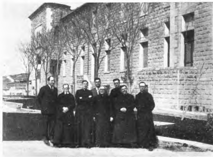
SIRIA - Aleppo - La Scuola Salesiana "Giorgio Salem".

Da noi il problema delle Colonie è in programma fin dalla fondazione dei nostri istituti in posizioni climatiche, ove si tengono abitualmente aperte le porte anche nel periodo delle vacanze. La prima guerra mondiale, con la vulnerazione e la denutrizione di tanti teneri organismi, impose una forte intensificazione di questa forma di apostolato; la seconda non fece che accrescerne l'urgenza e lo sviluppo. Diciamo forma di apostolato, perchè noi non ci limitiamo alle cure igieniche, terapeutiche e ricostituenti, ma completiamo