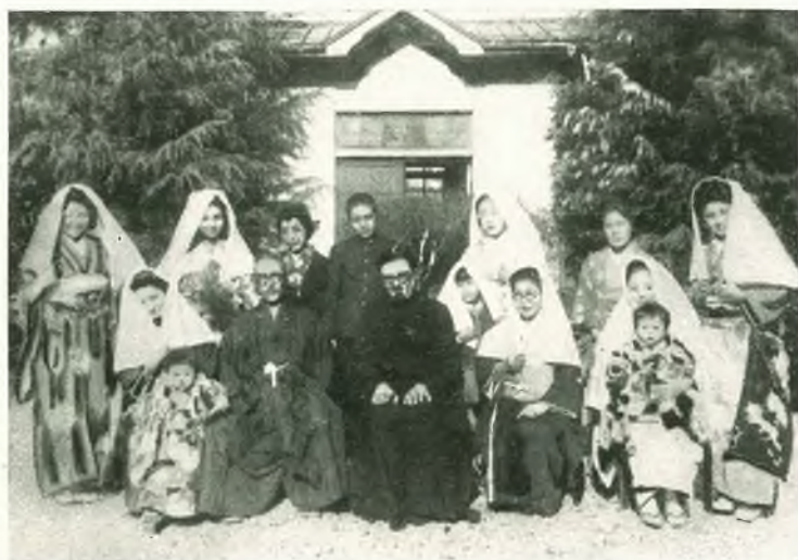
GIAPPONE - Un ex allievo battezzato con tutta la famiglia.

Abbiamo avuto decine di proposte ed offerte di case e di terreno per iniziare qualche opera salesiana da un capo all'altro dell'India portoghese. Siamo stati ufficialmente invitati anche negli altri possedimenti portoghesi di Diu e di Damao. Recentemente le autorità municipali di due importanti centri commerciali nel distretto di Salcete e del porto di Marmagoa hanno messo a nostra disposizione vasti terreni. Il 28 febbraio si benedisse la prima pietra dell'Oratorio festivo di Calangute nel distretto di Bardez con grande concorso di amici e di ammiratori. Quindici dei